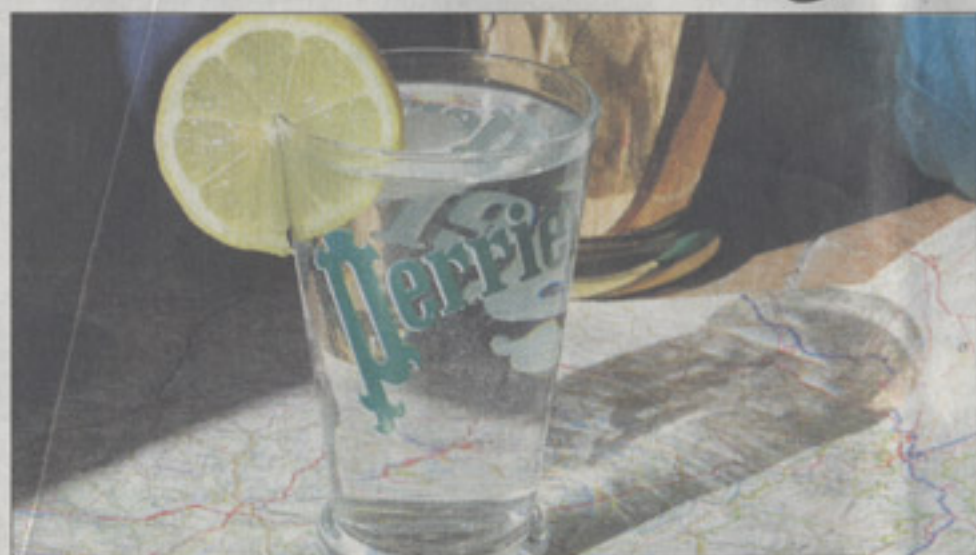
En route pour Vergèze, une petite bourgade entre Nîmes et Montpellier, mais un site connu dans le monde entier. POR François FREY

site rafraîchissante l'en est : celle site de Perrier, dans le Gard, là où écoule la grande eau aux petites bulles. Après qu'une visite : un véritable spectacle, accompagné de documents vidéo sonores. Voir... et à boire avec modération.